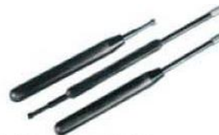
Enrolador e Desenrolador Manual de fios